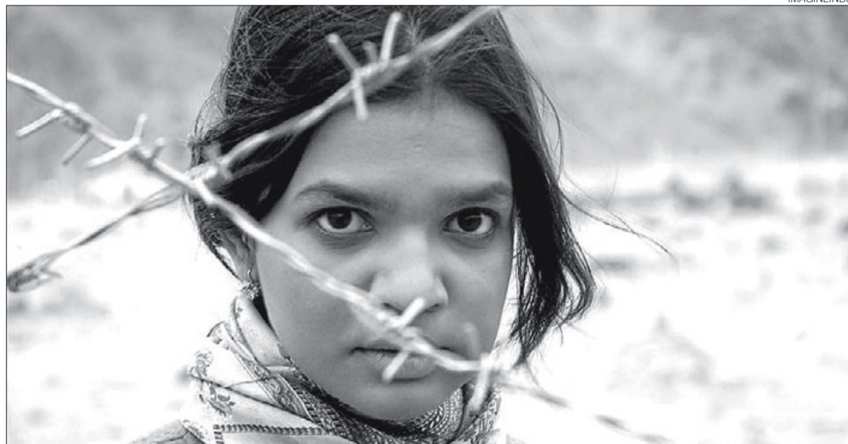
▶▶ Fotograma de la película Frozen , que abre hoy la muestra de cine indio en Casa Asia.

CASA ASIA PROYECTA EL MEJOR CINE INDIO EN LA MUESTRA IMAGINEINDIA BCN